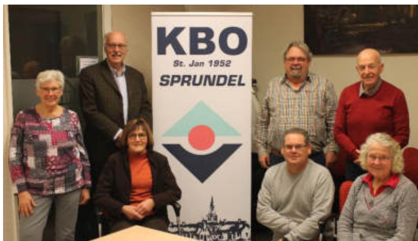
Het huidige bestuur met de nieuwe banner

Op de volgende pagina's vindt u weer een kruiswoordpuzzel en een woordzoeker. De oplossingen kunt u weer inleveren voor 19 januari per e-mail secretariaat@kbo-sprundel.nl of in de KBO-brievenbus in de Trapkes.